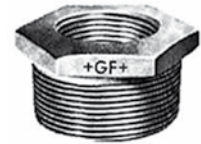
Figur Nr. 241 - Reduktion verzinkt