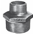
Figur Nr. 245 - Reduktionsdoppelnippel