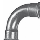
Figur Nr. 2 - Bogen 90°