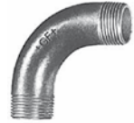
Figur Nr. 3 - Bogen 90°