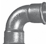
Figur Nr. 2a - Bogen 90°